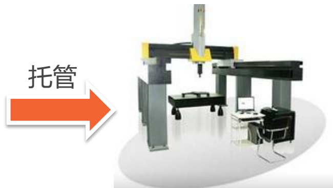
专业数据采集服务站 专业的地方标准化机构