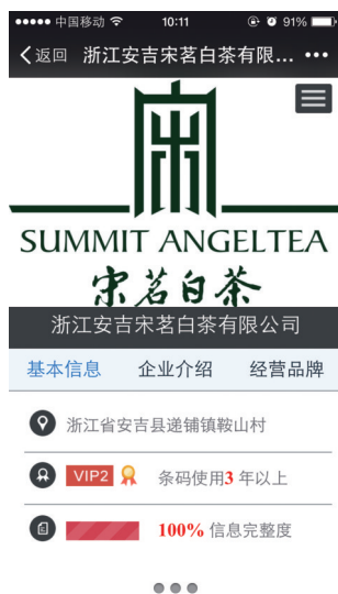
图1 企业手机用户界面

条码微站提供给企业二维码管理功能,可以给企业提供四个层级的(企业级、产品级、批次级、单品级)二维码,如果消费者扫描企业级二维码,会自动进入企业手机用户界面(见图1),如果是其他层级二维码会进入相应的产品展示界面(见图2)。